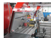
HOTTE POUR LE MEULAGE

Une enceinte de soudage à ventilation par refoulement utilisée pour souder d'autres métaux peut souvent contrôler les expositions au béryllium pendant le soudage. Si les pièces soudées sont nettoyées par abrasion, une ventilation doit être prévue pour éviter la production de particules aéroportées contenant du béryllium pendant les opérations de nettoyage.